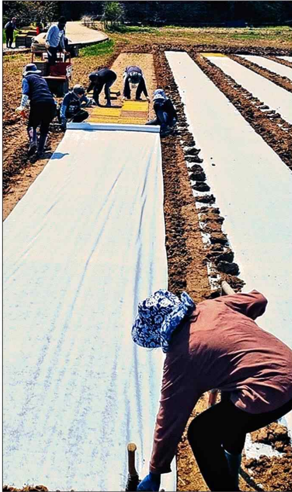
거창군 외국인 계절근로자들이 밭에서 일하고 있다.

거창군 '중개업자 근절 대책' 성과 이중 계약·임금 갈취 '꼴머리' 농촌일손담당·고용상담실 설치 '근로자 선발 권한' 농가로 이전 올해는 이탈자 한 명도 없어