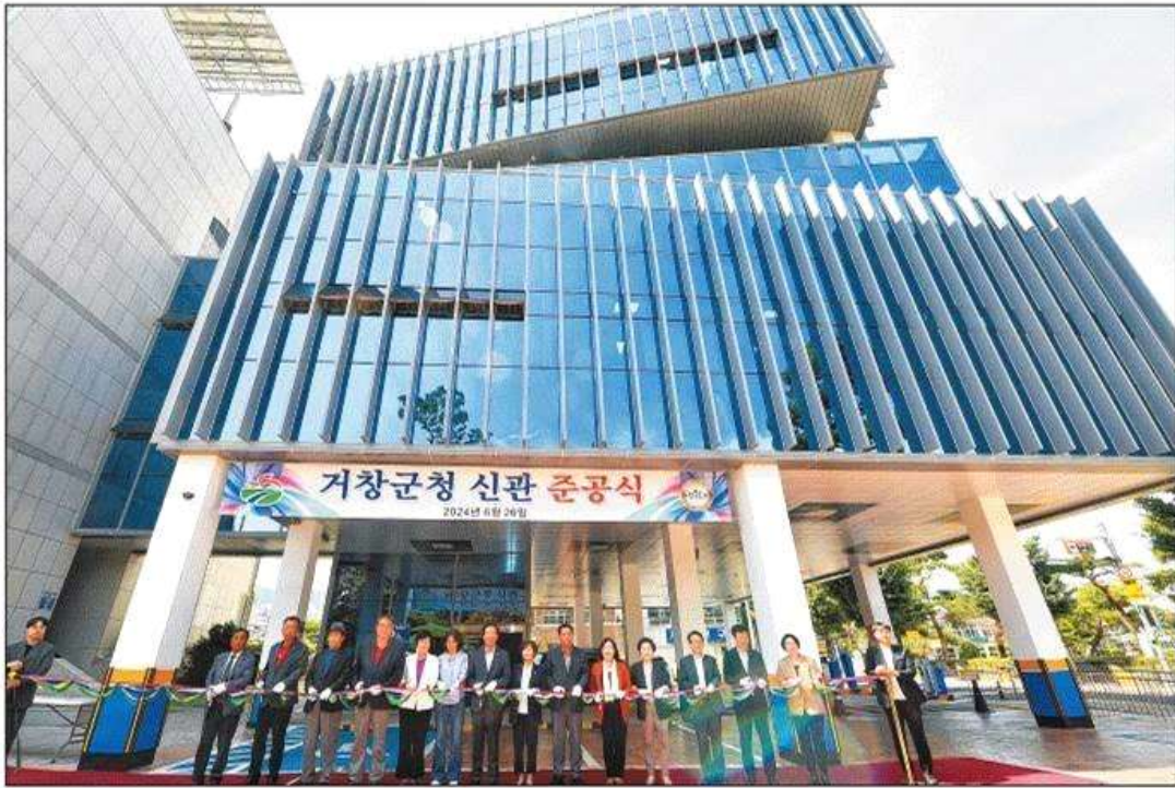
지난 26일 열린 거창군청 신관 준공식.