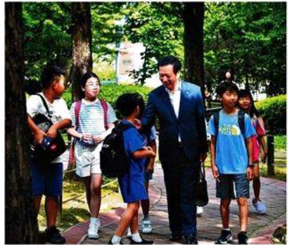
구인모 거창군수가 지난 28일 '군수와 함께하는 등갯길'에서 이야기를 나누고 있다.