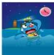
장시간 수영 NO, 호수나 강에서 혼자 수영 NO