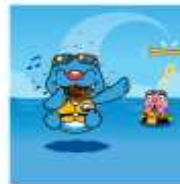
건강 상태가 좋지 않을 때, 배가 고프거나 식사 후에는 수영 NO