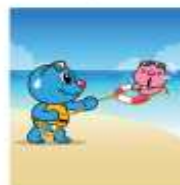
가급적 튜브, 장대 등 부위 물건을 이용한 안전구조