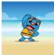
수영을 하기 전에는 반드시 준비운동을 하고 구명조끼를 착용한다.