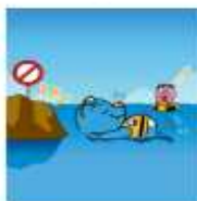
수영능력 과잉은 금물, 무모한 행동 NO