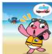
물에 빠진 사람을 발견하면 주위에 소리쳐 알리고 즉시 119에 신고