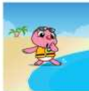
물에 들어갈 때는 심장에서 먼 부분부터(팔-얼굴-가슴)부터