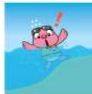
물이 갑자기 깊어지는 곳은 특히 위험