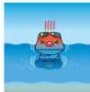
소름이 돋고 피부가 당겨질 때는 몸을 따뜻하게 감싸