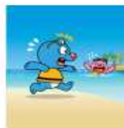
구조 장비 없는 사람은 무모한 구조 NO, 함부로 물에 뛰어들면 NO