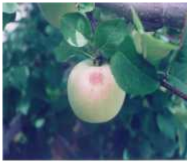
② 일소 피해부 확대