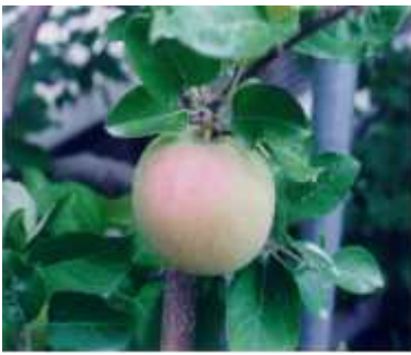
① 일소 초기 증상