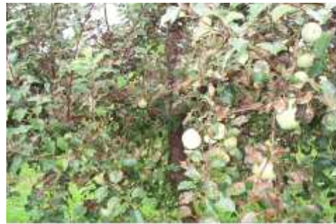
<엽소 피해 증상>