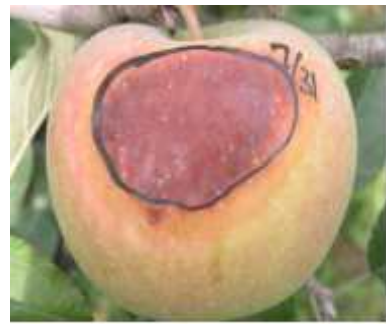
③ 일소 후기 증상