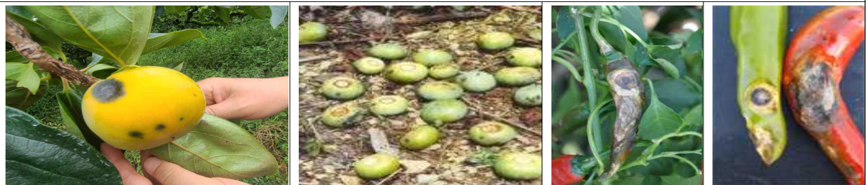
단감 탄저병 증상