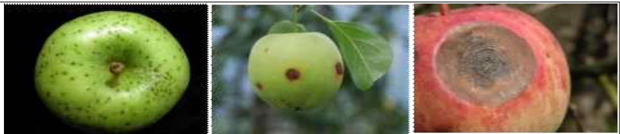
사과 탄저병 증상