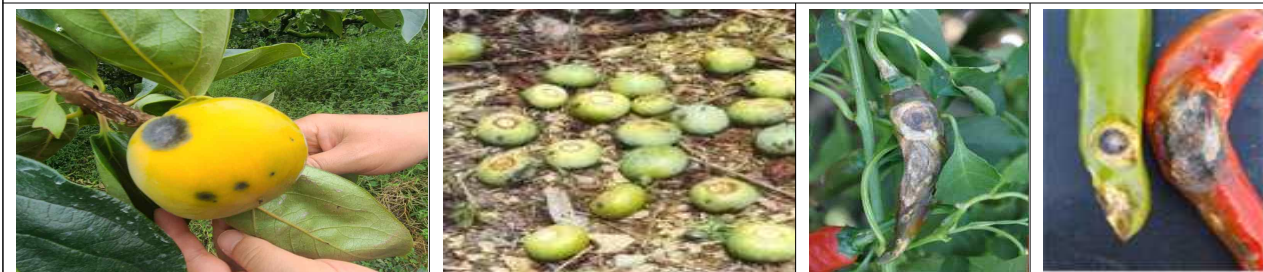
단감 탄저병 증상