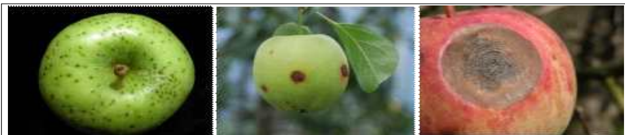
사과 탄저병 증상