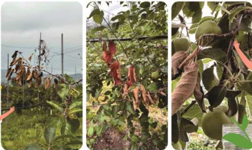
사과 부란병에 의한 가지 마름 증상

➔ 사과 부란병은 가지 전체가 마르고, 잎자루 등의 변색 없이 한꺼번에 마름