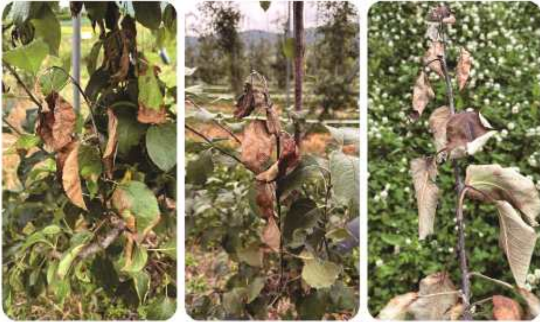
사과 화상병에 의한 가지 마름 증상

➔ 사과 화상병의 경우, 마른 가지 주위 잎의 잎자루, 주맥 등이 변색되어 있음