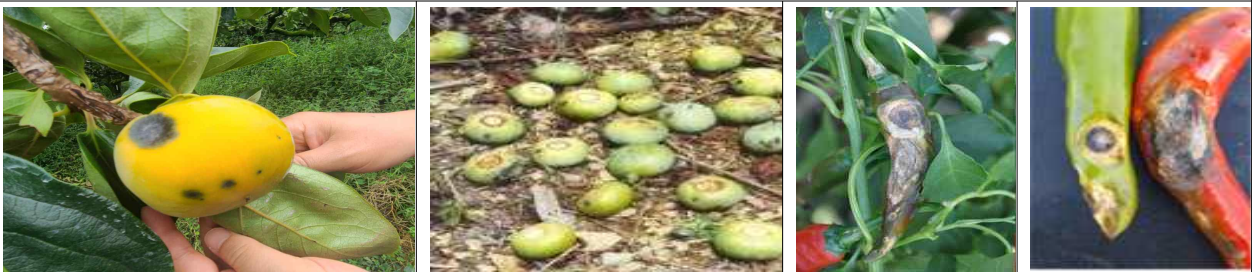
단감 탄저병 증상