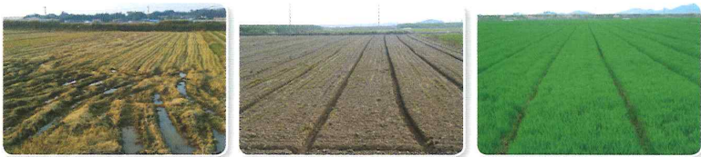
[배수 불량 포장]