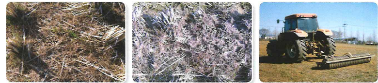
[건조(가뭄)에 의한 피해]