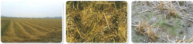
[벼짚 미수거에 의한 IRG 생육 불량]