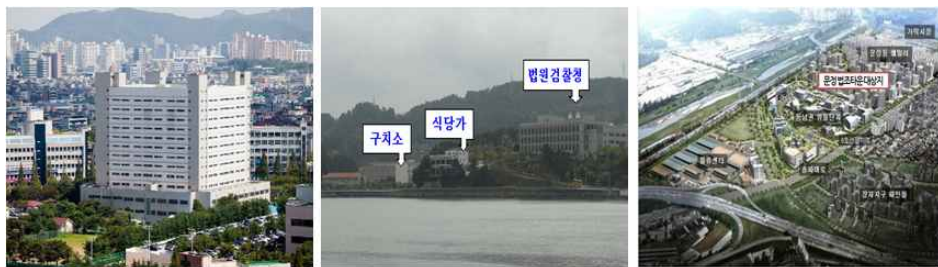
[ 인천 학익동 법조타운 ]