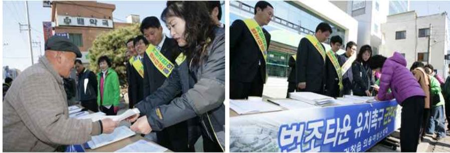
[ 법조타운 유치를 위한 대군민 서명운동 (군민 30,000여명 서명) ]