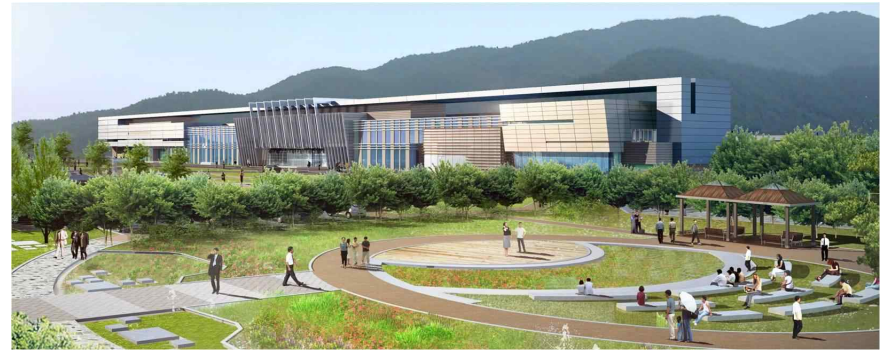
[ 거창구치소 조감도 ]